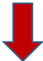
Schéma directeur à décliner vers les Clubs (en cohérence fédérale)